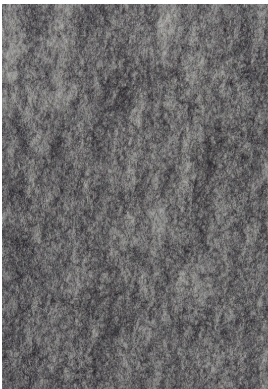
jasny szary / light grey / hellgrau