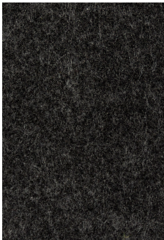
ciemny szary / dark grey / dunkelgrau